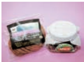
黒せんべい1袋・黒らっきょう1瓶のセット

「とっとり市報」へのご意見、ご感想をお寄せください。 抽選で5名様にプレゼントします。