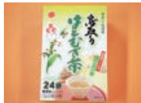
鳥取のはと麦茶 1箱 (7g × 24袋)

「とっとり市報」へのご意見、ご感想をお寄せください。 抽選で5名様にプレゼントします。