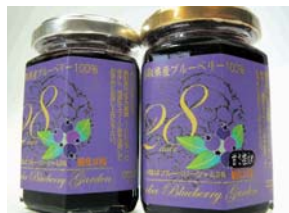
いなばブルーベリージャム 28 (糖度 25 度、40 度) 2 個セット

「とっとり市報」へのご意見、ご感想をお寄せください。 抽選で 5 名様にプレゼントします。