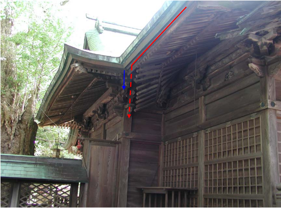
拝殿幣殿の屋根の野地板、垂木の折れた様子←(遠景)