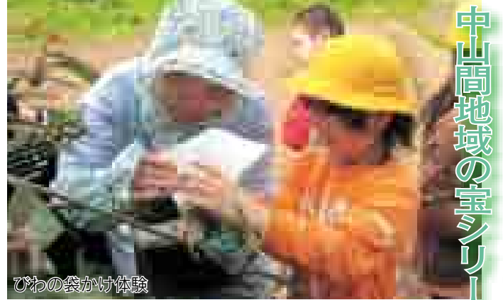
びわの袋かけ体験