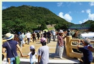
屋宝珠の通り方向の姿を再現し完成