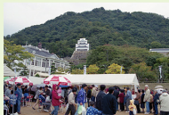
第1回鳥取三十二万石お城まつりで復元された二ノ丸三階櫓の一部

このように学術的に価値の高い城跡の内、江戸時代の建物復元を通して中心市街地を活性化しようと2000年を始めたのが、市民有志による鳥取三十二万石お城まつりでした。この熱意を受けた鳥取市は、2036年までに二ノ丸三階櫓復元を盛り込んだ整備計画を2006年に策定し、2018年には屋宝珠櫓(大手櫓)が、2021年3月には中ノ御門表門(大手門)が復元され、今後数年で城の大手登城路は住時の姿を取り戻す予定です。