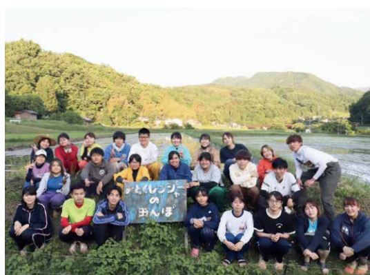
▲三朝町の田んぼでの活動(2021年5月)

「大学生も田んぼや畑に触れたいというニーズがあるのは知っていて、あとは仕組みをどうするかだと思っていました。現在は、学生が集落の食材を加工・販売する販売班、農村集落の魅力を伝える広報班、集落と学生の交流を深める企画を立てる交流班に分かれ、学生がやりたいことを自主的に形にして動いてくれています」