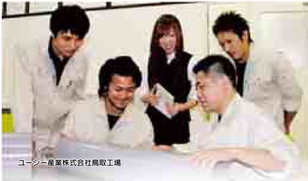
ユーシー産業株式会社鳥取工場