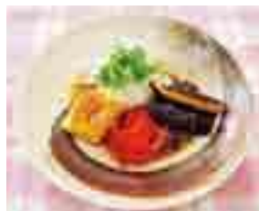
豆腐と茄子の揚げあけ 香味ドレッシング

ランライスのとろろ卵オムライス ス マ手づくり!! 変わり肉だんご △豆腐と茄子の揚げあけ 味ドレッシング