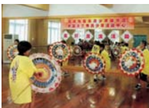
しゃんしゃん傘踊りの披露