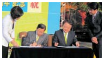
共同宣言文に署名する両市長