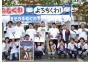
地元鳥取県を代表して出展される鳥取とうふちくわ総研のみなさん