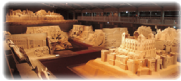
世界初の砂の美術館