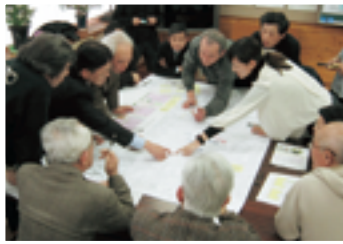
▲遷喬地区で事業に関するワークショップを開催 ▶模型を前に議論を深める検討会

このうち戎町地区では、地権者が主体となり、「地域内での住み替えと住み続けられる街なか居住」をテーマにした防火建築帯の共同建替えについて勉強会を開催してきました。