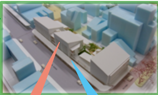
共同建替事業検討模型

現在、地権者の検討会に加え、専門家や周辺商業者の参加もいただきながら、3つの部会に分かれて事業の実現に向けた話し合いを重ねています。（左図）