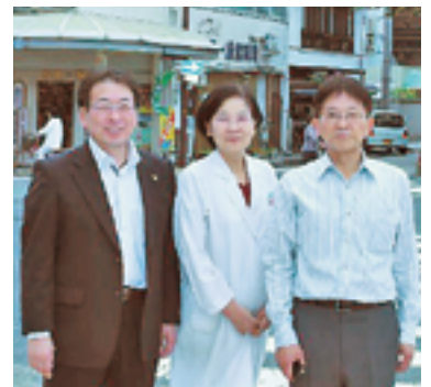
「安心して暮らせるコミュニティと新しい発見の生まれる住まい方を目指します」と語る、組合員のみなさん

商業床に出店したい人や、この場所に住んでみたい人、プロジェクトに興味のある人など、お気軽にご連絡ください。