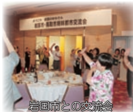
岩内市との交流会

センターでは、図書の貸し出し(蔵書数:650冊)や、子供用便座の設置、啓発講座での託児サービスなどをを行っています。今後も、広くみなさんに親しまれ、気軽にご利用いただけるよう努めてまいります。