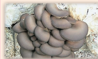
ヒラタケ (500 ㍉)

ヒラタケは味にも香りにも癖がなく、汁物、鍋物、天ぷら、うどん、炊き込みご飯などさまざまな料理に利用できます。「おお!ヒラタケ美味しそうなのが生えてる!」