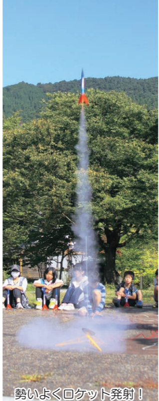
勢いよくロケット発射!

天体観察から一夜明けて、いよいよモデルロケットの打ち上げです。ロケットに火薬を詰めて発射台にセット。「5、4、3、2、1、0!」子どもたちの元気なカウントダウンからロケットは空高く飛んでいきます。勢いよく飛んで行く