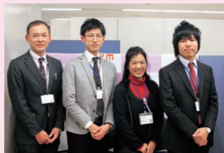
職員一同お待ちしております！

結婚という人生最大のライフイベントを市をあげてお祝いしたいという思いで、市民課では『すごい！鳥取市婚姻届用紙』の提供および『すごい！鳥取市婚姻記念証』のプレゼントを開始しました。また、駅南庁舎では記念撮影用のお祝いボードを設置していますので、お二人の記念にぜひご利用ください。