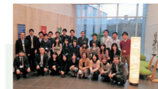
JCBエクセのみなさん

これからも鳥取の企業市民として、地域経済や雇用環境の向上に貢献すべく、地域に根差した企業となることをめざしてまいりますので、宜しくお願いします。