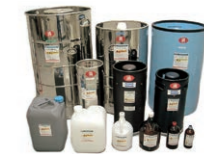
電子工業用薬品・試薬

当社が製造する電子工業用薬品は、携帯電話やスマートフォン、太陽電池、LEDなどを製造するときに欠かせないもので、生産効率向上や環境負荷低減に貢献する製品です。また、試薬は、試験研究分野をはじめ環境分析や生産技術分野にいたるまで、幅広い企業や学校で使われています。