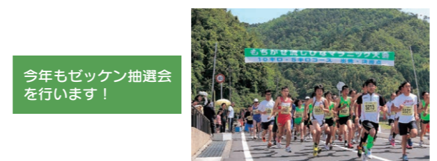
今年もゼッケン抽選会を行います!

申込期間 4月15日(水)必着 ☎教育委員会用瀬町分室 (〒689-1211 用瀬町別府34-7) ☎ 0858-87-2288 ☎ 0858-87-2310