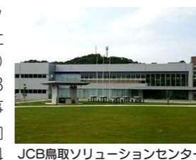
JCB鳥取ソリューションセンター

当社は、国内大手クレジットカード会社である株式会社ジェシービー(以下JCB)の100%子会社として、JCBグループの事業基盤拡大と事業継続計画(BCP)の実効性向上を目的に設立され、2014年8月より鳥取市にて本格操業を開始しました。