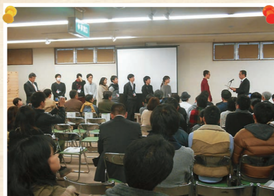
市長による修了証書授与