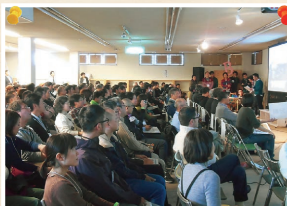
公開プレゼンテーション