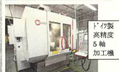
ドイツ製 高精度 5軸 加工機