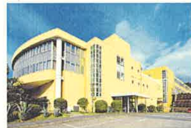
航空機・医療部品