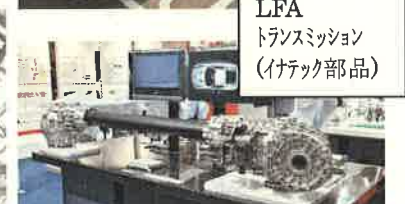
LFA トランスミッション (イナテック部品)