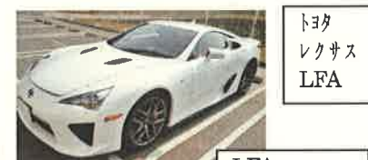
トヨタ レクサス LFA