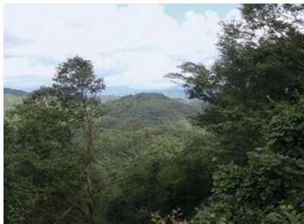
本丸から望む本陣山