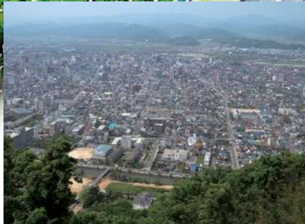
本丸から望む鳥取平野