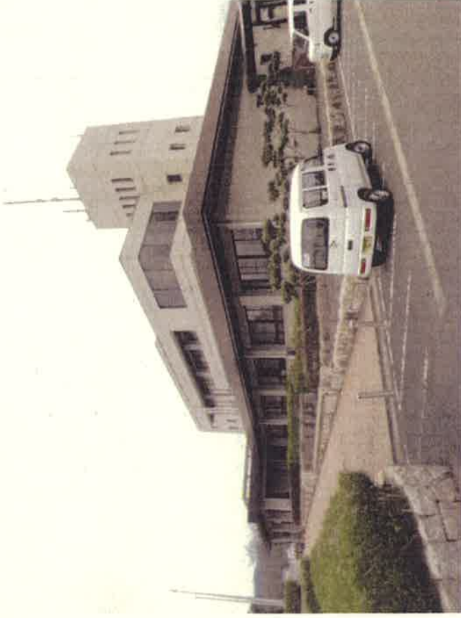
鹿野地区保健センター