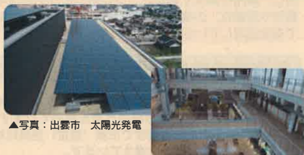
▲写真：出雲市 太陽光発電

自然エネルギーの活用、エネルギーの有効利用、エネルギー負荷の低減など、環境との共生が図れる庁舎とします。