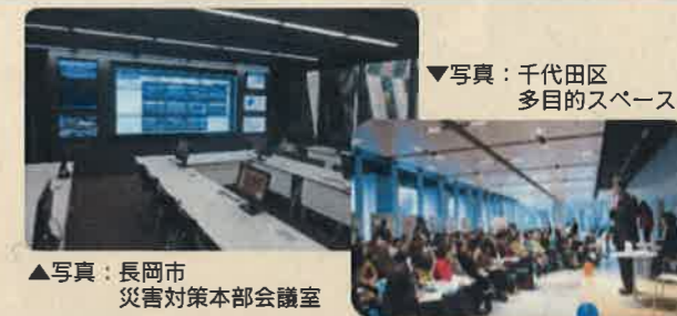
▲写真：長岡市 災害対策本部会議室