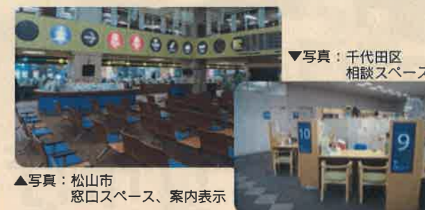
▲写真：松山市 窓口スペース、案内表示

※ユニバーサルデザイン：すべての人が暮らしやすいように、まちづくり、ものづくり、環境づくりなどを行っていることとする考え方。