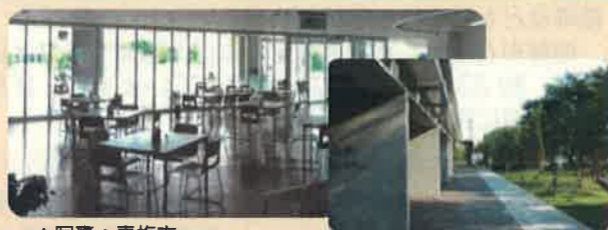
▲写真：青梅市 市民交流スペース