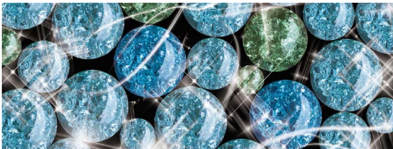
※写真はクラッシュグラスのイメージです。

※クラッシュグラス：直径約2cm前後の熱したガラス玉を氷水に入れることによって細かなクラックを入れたもの。下方向から光をあてる事により光が乱反射し幻想的で神秘的な光を放ちます。