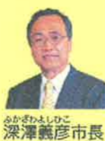
鳥取市長 高橋 謙二

人口が減少していくという状況を前にして、自治体が財政を維持し、市民のみならず必要とするサービスを持続させていくためには、これまで以上の努力が必要です。