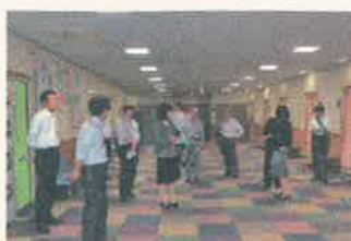
健診待合フロアは広いスペースを確保

整備することとしていきます。 倉敷市保健所の施設では、保健センター業務も行っており、その隣に子どもからお年寄りまですべての市民が健康で生きがいのある生活を営むための支援施設「くらしき健康福祉プラザ」を有することで、周辺一帯が市民に身近なエリアとなっています。 このたびの視察を参考に、駅南庁舎の整備にあたって保健所に必要な諸室、あわせて整備すべき市民サービス機能について、今後検討していくことにしています。