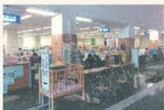
各手続窓口はワンストップサービスを実現

本市は、駅南庁舎に新たな保健所、保健センター、子育て支援機能を集約し、業務の連携強化を図り、保健医療・環境衛生、子育てなどの総合支援の拠点として