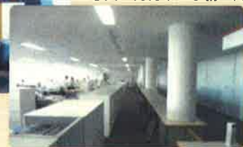
▼写真：青柳市 事務空間