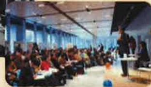
▼写真：千代田区 多目的スペース