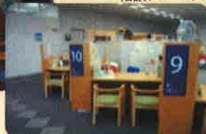
▼写真：千代田区 相談スペース