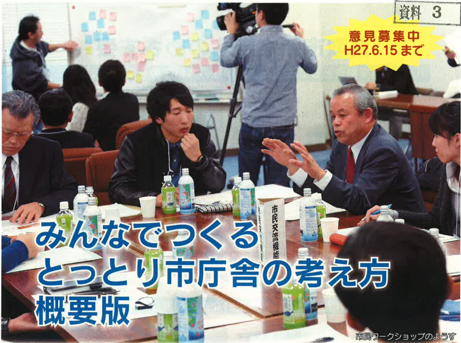
市民ワークショップのようす