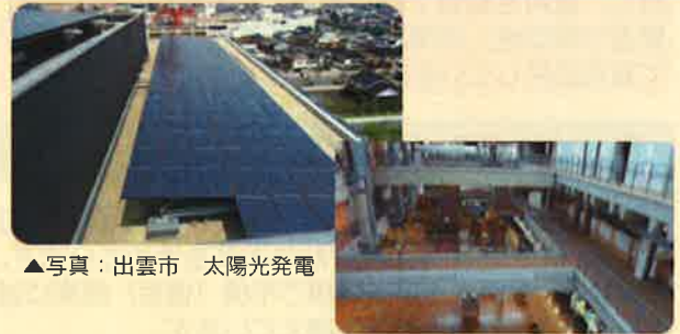
▲写真：出雲市 太陽光発電

自然エネルギーの活用、エネルギーの有効利用、エネルギー負荷の低減など、環境との共生が図れる庁舎とします。