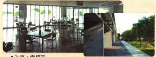
▲写真：青森市 市民交流スペース