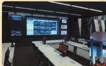
▲写真：長岡市 災害対策本部会議室