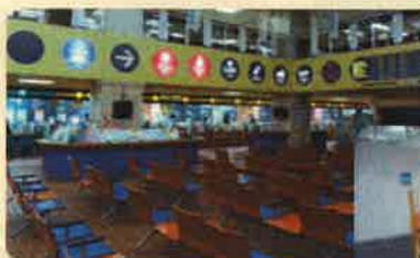
▲写真：松山市 窓口スペース、案内表示

※ユニバーサルデザイン：すべての人が暮らしやすいように、まちづくり、ものづくり、環境づくりなどを行っていこうとする考え方。