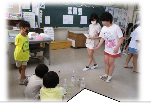
【チャレンジ美保っ子】各学級で出し物を考え協力しながら準備・運営するとともに、異学年交流をとして相互理解を図る。