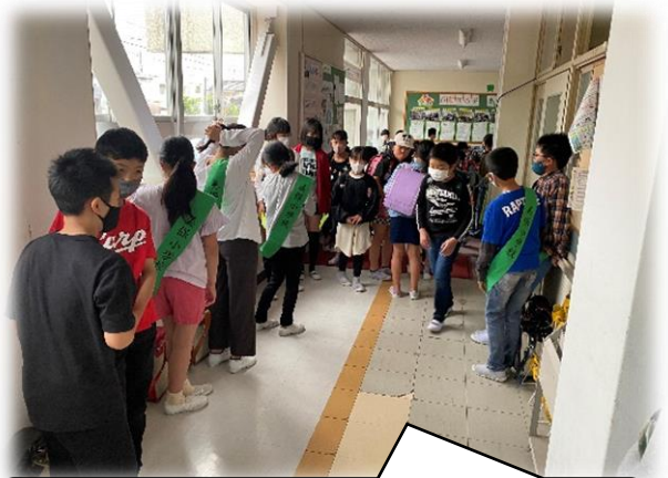
【あいさつ運動】年間を通して運営委員会が毎朝あいさつ運動を実施。