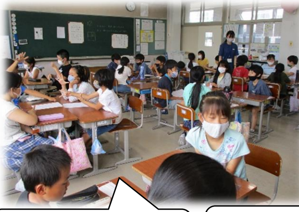
【つながりタイム】毎週水曜日にアドジャンを実施。