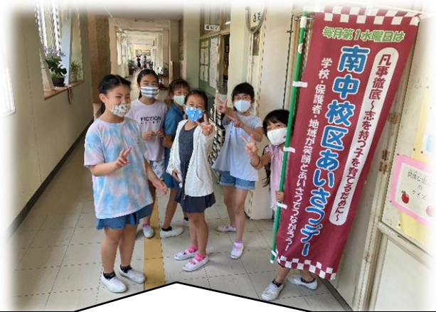
【全校での取り組み】 学校全体で取り組むことを代表委員会で話し合い、各学級が順番に校舎内を回り、あいさつ運動を実施。あたたか言葉、いいところ紹介など、各学級でも取り組んだ。