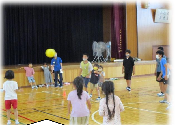
【スマイルタイム】年間を通して毎月、学級遊び、ペア学年での交流を実施。