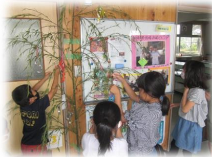
縦割り班に分かれて、笹に願い事などを書いた短冊をつけセタ飾りを作りました。