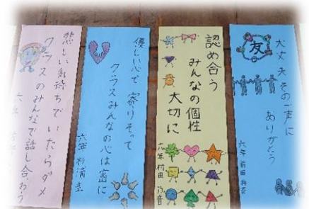
6年生の人権標語です。