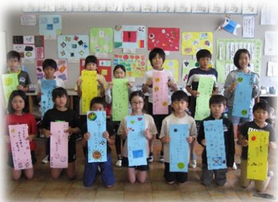
5年生の人権標語です。