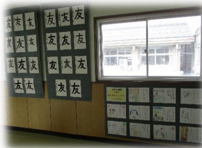
廊下に掲示しました。