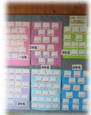
全校の自分のよいところを掲示しました。