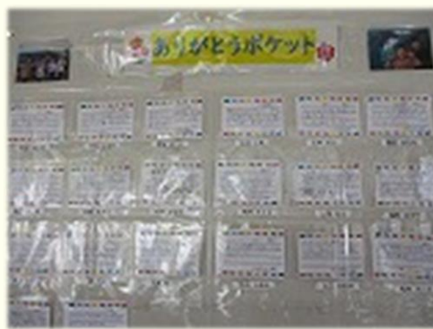
「ありがとうカード」