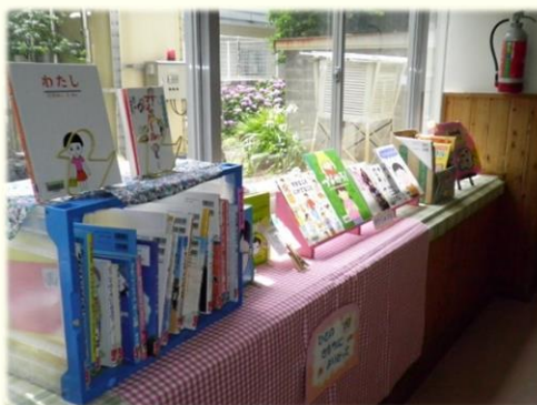
人権に関する本の紹介 (図書館前)