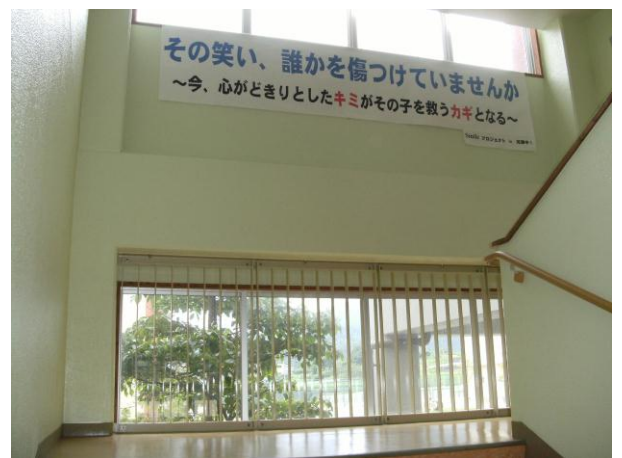
校舎内でのスローガン掲示