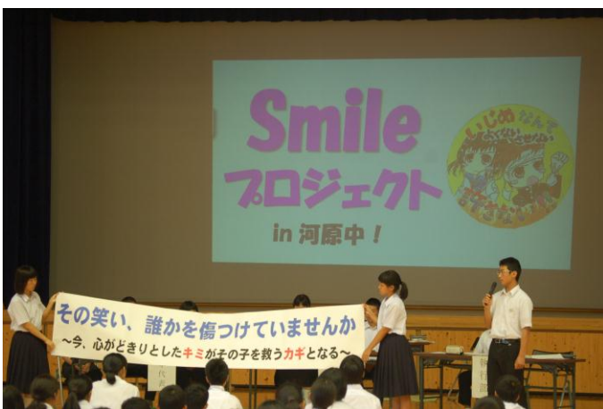
生徒会スローガンの発表