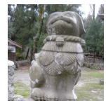
鷲峰神社・狛犬(鹿野町)

と き 10月10日(月祝) 13:30～ ところ 青谷町内(集合場所：あおや郷土館) 参加料 無料 定員 20人 ※要予約 ※申込み受付：9月10日(土)～