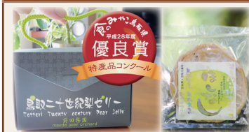
「鳥取二十世紀梨ゼリー」(まるごと)と「ほしなし」(梨ドライフルーツ)のセット

平成28年度「食のみやこ鳥取県」特産品コンクールで優良賞を受賞した、さわやかな甘さと梨のシャキシャキした食感が特徴の、「二十世紀梨がまるごと1個入ったゼリー」と、厚切りの梨果実(王秋梨を予定)を砂糖、添加物なしで約2日間干し、しっとりした食感と甘さが特徴の「ほしなし」をセットでお届けします。