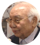
中島 貞夫 氏 映画監督

'78年鳥取市役所入り。'06年助役(現鳥取市副市長)に就任。'14年1月に鳥取市副市長を退任。'14年4月鳥取市長に就任。