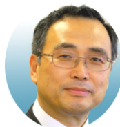
深澤 義彦 氏 鳥取市長

'78年鳥取市役所入り。'06年助役(現鳥取市副市長)に就任。'14年1月に鳥取市副市長を退任。'14年4月鳥取市長に就任。