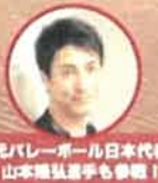
元バレーボール日本代表 山本隆弘選手も参加!