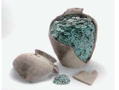
下坂本清合遺跡出土土埋鏡(鳥取県埋蔵文化財センター蔵)

企画展 鳥取を掘る 2017 鳥取市内で近年行われた発掘調査の成果を紹介。「そもそも、埋蔵文化財・発掘って何?」についても、合わせて紹介。 とき 3月26日(日)まで 観覧料 無料