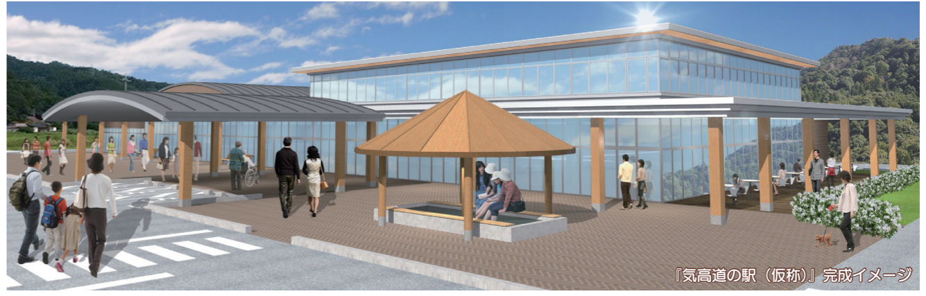
『気高道の駅 (仮称)』完成イメージ

施設概要 駐車場: 大型車 (22台)、小型車 119台、二輪車など 駅舎: レストラン、物産販売コーナー、飲食コーナー、情報・休憩コーナー、コンビニなど その他: 足湯、イベントスペース、ガソリンスタンドなど ※基本設計説明書は、本市公式ホームページでご確認いただけます。