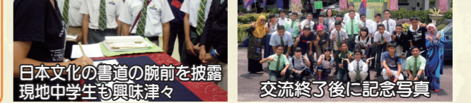
日本文化の書道の腕前を披露 現地中学生も興味津々