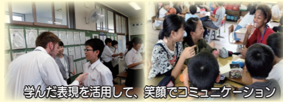
学んだ表現を活用して、笑顔でコミュニケーション

小中学校を訪問して「きなんせ! English World (キャラバン)」を行っています。ALTや地域の外国人との活動を通して視野を広げ、児童生徒がたっぴりと英語にふれ、英語で積極的にコミュニケーションをとる意欲を高めるきっかけとすることをねらいとしています。