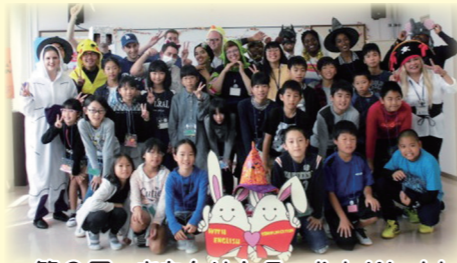
第2回 きなんせ! English World テーマ「ハロウィン」(10月14日)

鳥取市教育センターでは、年4回、季節や行事などにちなんだ活動を通して、英語に親しむイベントを開催しています。