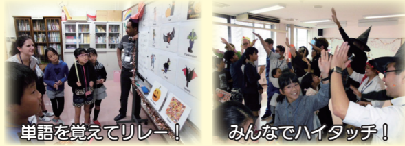
単語を覚えてリレー! みんなでハイタッチ!