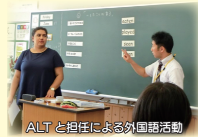
ALTと担任による外国語活動

先進的な取り組みとして、気高中学校区に専科教員を配置し、担任・ALTと連携した外国語の学習のあり方を研究しています。小学校の先生も中学校の英語の先生の授業からアイデアを学ぶなど、取り組みの輪が広がっています。