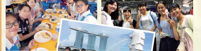
現地大学生の案内でシンガポール市内の見学