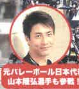
元バレーボール日本代表 山本隆弘選手も参加!