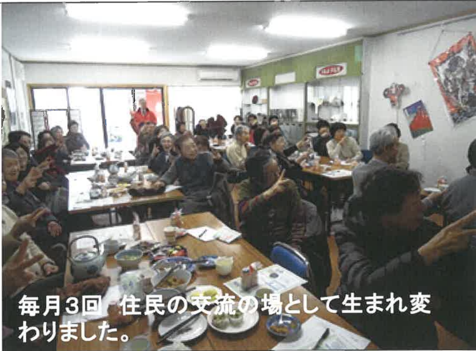
毎月3回 住民の交流の場として生まれ変わりました。