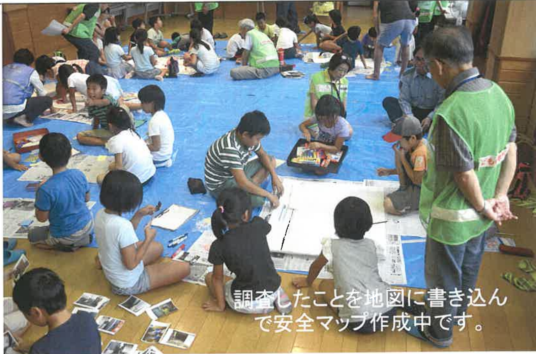
調査したことを地図に書き込んで安全マップ作成中です。