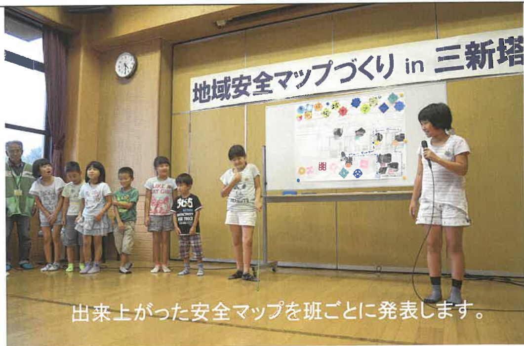
出来上がった安全マップを班ごとに発表します。