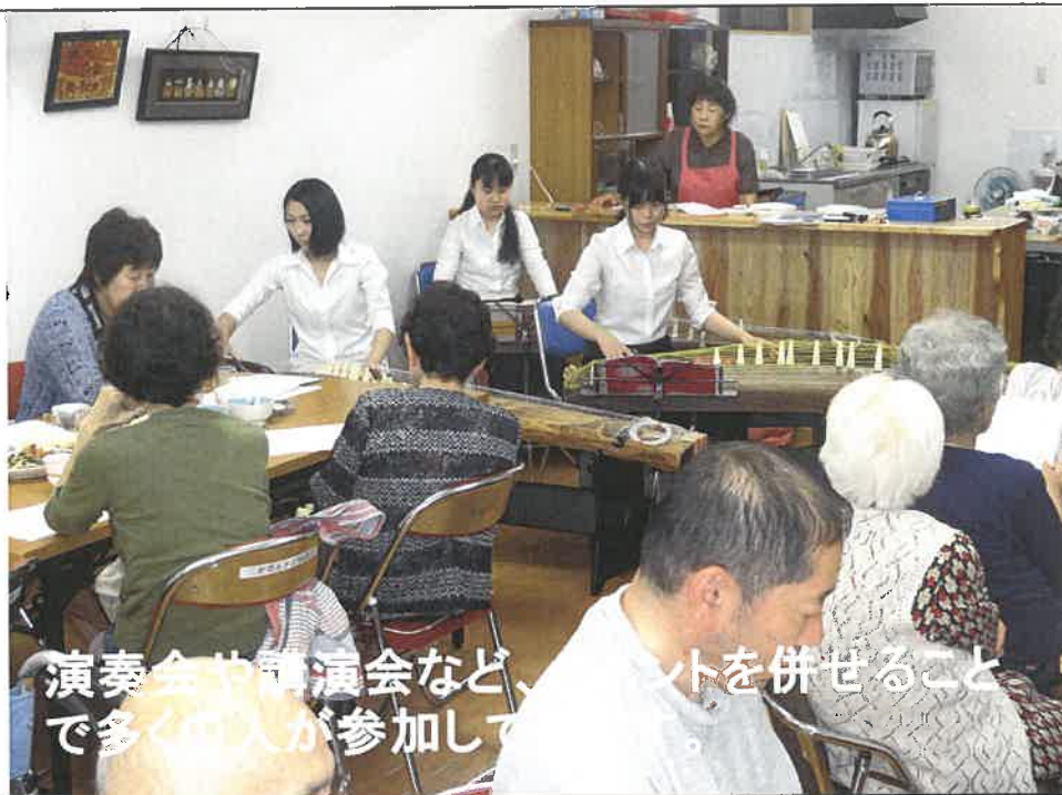
演奏会や講演会など、イベントを併せることで多くの方が参加して