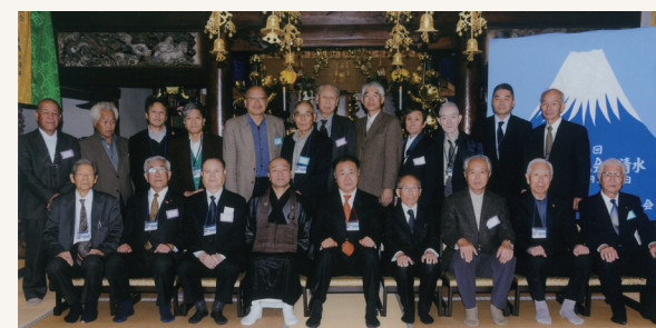
昨年は全国吉川交流会を楞嚴院(静岡県清水区)で開催

0857-22-6338 鳥取吉川会(真教寺内) 2020年が経家公自刃440年であり、鳥取市で第5回全国吉川会交流会が開催される予定です。鳥取城も整備され、お堀の擬宝珠橋も新築されます。今から準備を進め、遠くからのお客様を迎えたいと思います。