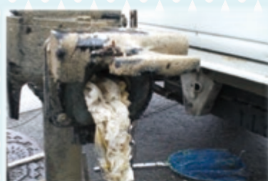
布やウェットティッシュで詰まったポンプ。修理や清掃には、多くの人手と費用がかかります。

家から流した水は、地下に埋められている下水管を通って、下水処理場へ。そこでは、微生物処理などで汚れをきれいにしてから川に流します。誤った使い方をすると、下水管が詰まったり、処理場の維持・管理に支障が生じたりと、さまざまな不具合が発生する原因になります。下水道を守るため、みなさんのちょっとした気遣いをお願いします。