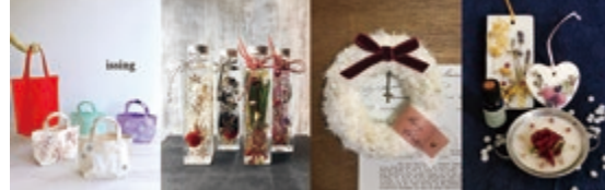
※花材は変更になる可能性があります。