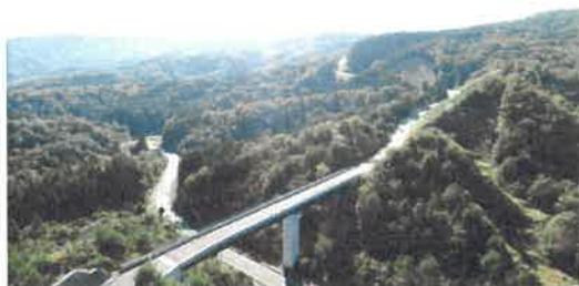
フォレストロード上空から岩美広域農道を望む(平成29年10月撮影)