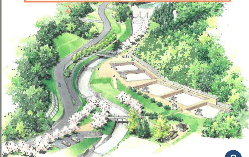
完了後のイメージ図