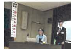
講演会 自然を生かした農業 生物農業について 「偉大なる虫たち」(於 大茅地区公民館 H28.11.18)