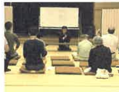
活動報告会 (於成器地区公民館 H29.6.10)