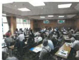
〔関連事業〕大伴家持生誕1300年まちづくりフォーラム(H29.7.8)