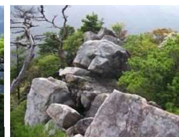
巨岩が幾重に(鳥居野ルート)