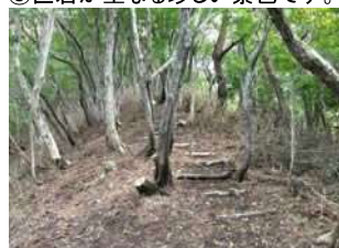
⑦くだらかな稜線上の登山道