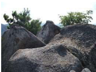
⑤巨岩が重なる珍しい景色です。