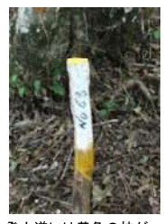
登山道には黄色の杭が30mおきにつけられています。全部で67本ありますので、登山の目安にしてください。