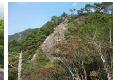
巨岩「鬼の洗濯板」(鳥居野ルート)