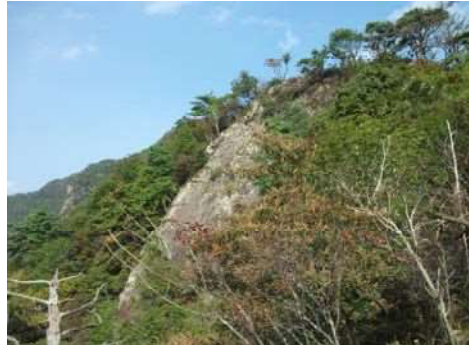
⑥巨大岩壁「鬼の洗濯板」