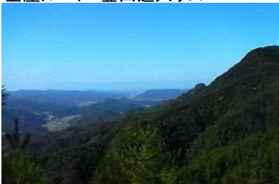
金屋ルートより鳥取方面を眺める