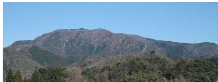
洗足山 ● 展望所