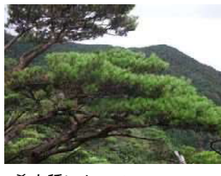
希少種ヒメコマツ