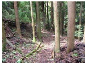
② 最初の山道です。急峻です。