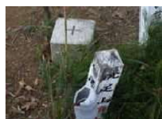
山頂の一等三角点