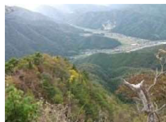
鳥居野ルートより