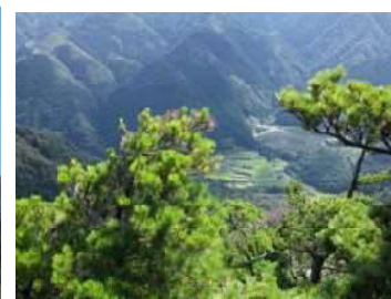
希少種ヒメコマツ(鳥居野)