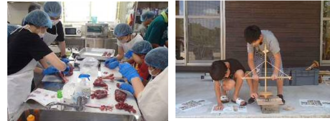
若者の参画事業（画像は成器地区：「いただきます」の食育事業）