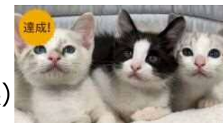
クラウドファンディング活用 （画像は野良猫の不妊・去勢手術補助事業への寄附募集）