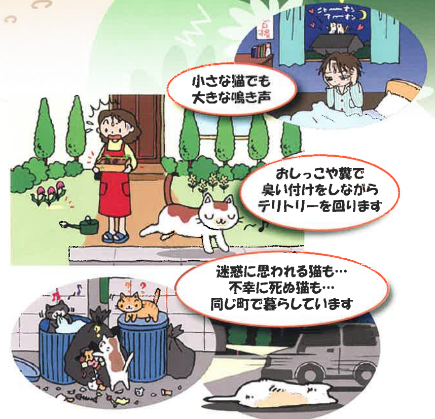
小さな猫でも 大きな鳴き声

野良猫に迷惑している人、野良猫の置かれている状況に心を痛めている人、野良猫にエサをやっている人、それぞれ立場は異なりますが、「野良猫を減らしたい」という思いは共通ではないでしょうか。