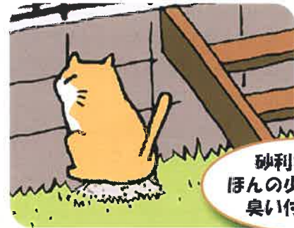
砂利などを ほんの少し盛って 臭い付けを…