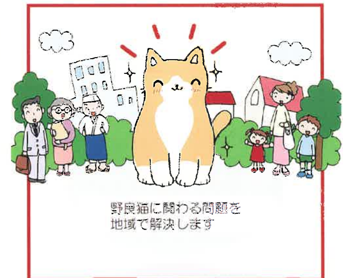
野良猫に関わる問題を 地域で解決します