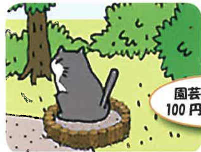
園芸用の柵を 100円ショップで