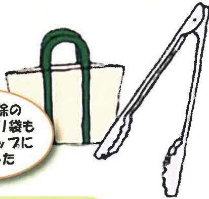
ウンチ掃除の トンクやポリ袋も 100円ショップに ありました