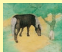
中谷晃「運さ日」 (鳥取市立鹿野学園蔵)