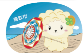
睡眠キャンペーンキャラクター「スーミン」

平成31年3月に「いのち支える鳥取市自死対策推進計画」を策定しました。「誰もが自死に追い込まれることのない鳥取市」を目指し、庁内各部署、関係団体、地域の皆さんと取組を進めていく必要があります。本市では、中高年の男性、若年層の自殺死亡率が高い状況にあるため、重点的に取組む対象としています。