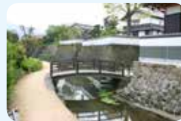
5. 新温泉町浜坂味原川地区