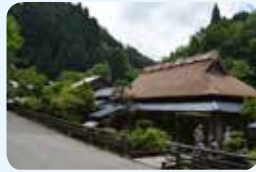
14. 智頭町板井原伝統的建造物群保存地区