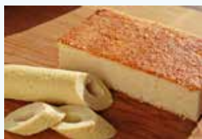
とうふちくわのバターケーキ

鳥取の名産品であるとうふちくわを焼き菓子にした、世界で1つだけのお菓子です。とうふちくわの香りを生かすため、鳥取県産の醤油を使い風味豊かに仕上げています。生地はふんわり軽やかで、世代を問わず食べやすくなっています。