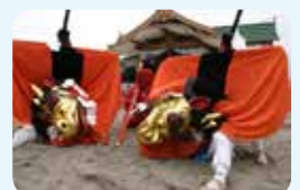
31. 但馬の麒麟獅子舞