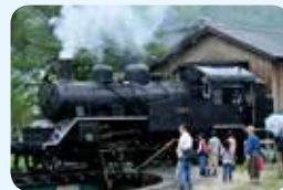
20. 若桜鉄道若桜駅本屋及びプラットフォーム、転車台ほか計23件