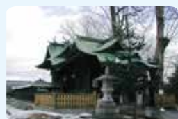
29. 聖神社本殿、拝殿及び幣殿