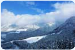
12. 氷ノ山後山那岐山国定公園