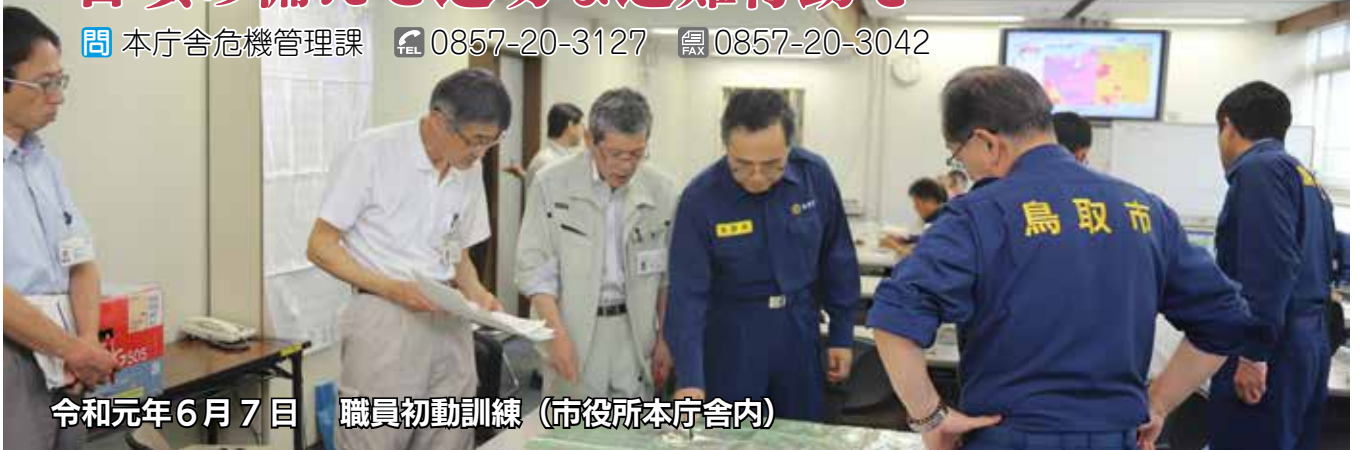
令和元年6月7日 職員初動訓練（市役所本庁舎内）

問 本庁舎危機管理課 TEL 0857-20-3127 FAX 0857-20-3042