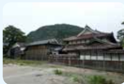
18. 太田家住宅主屋、新建、門長屋