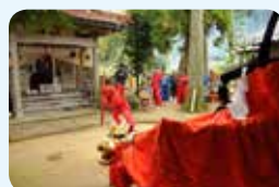
30. 因幡の麒麟獅子舞