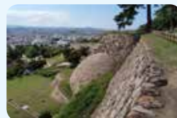
25. 鳥取城跡附太閤ヶ平