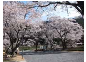
春には水源地稼働時より植えられている桜の大木が満開となり、来場者を迎えます。

このように観光地として人気を集め始めた旧美歎水源地水道施設ですが、さらに「近代化遺産」という側面からも、全国から支持を受けています。今回は、「近代化遺産」としての旧美歎水源地についてご紹介するとともに、7月24日から26日にかけて本市を中心に開催される全国大会についてご案内します。