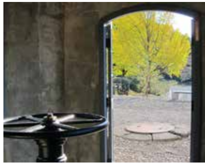
バルブの覆屋には、大正時代の新工法が用いられており、全国でも貴重な現存例です（写真左）。ガイダンス施設では、水源地の歴史や仕組みが学べるほか、当時の資料などが展示されています（写真右）。