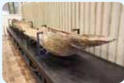
2. 桂見遺跡出土縄文時代遺物一括