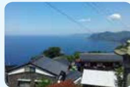
9. 因幡・但馬沿岸の岩石海岸の漁村集落