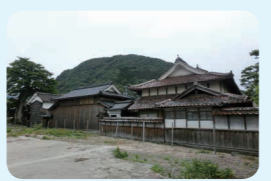
18. 太田家住宅主屋、新建、門長屋