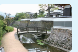
5. 新温泉町浜坂味原川地区