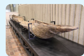
2. 桂見遺跡出土縄文時代遺物一括