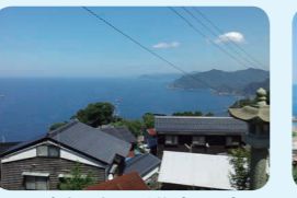
9. 因幡・但馬沿岸の岩石海岸の漁村集落