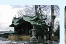
29. 聖神社本殿、拝殿及び幣殿