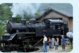
20. 若桜鉄道若桜駅本屋及びプラットフォームホーム、転車台ほか計23件