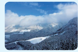
12. 氷ノ山後山那岐山国定公園