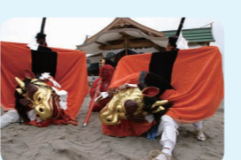
31. 但馬の麒麟獅子舞