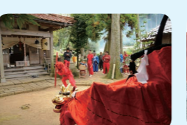
30. 因幡の麒麟獅子舞