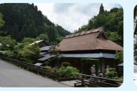
14. 智頭町板井原伝統的建造物群保存地区